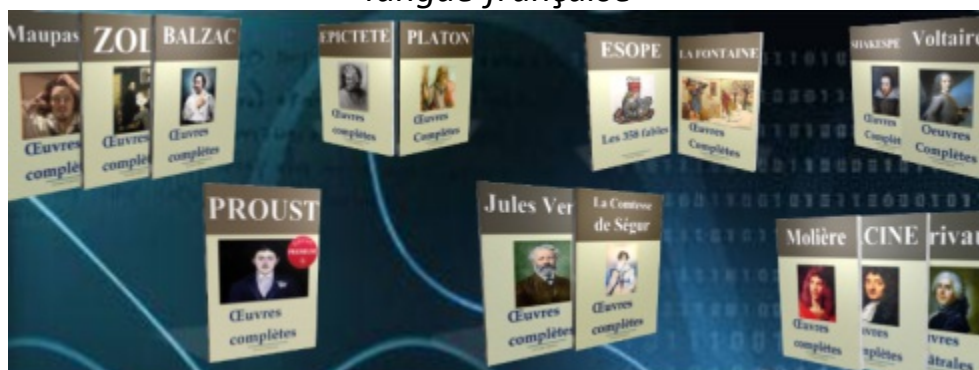
Plate-forme de référence des éditions numériques des oeuvres classiques en langue française

Retrouvez toutes nos publications, actualités et offres privilégiées sur notre site Internet